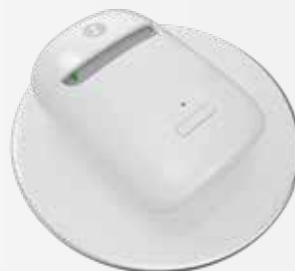
Preisgekröntes Design mit Audiologie der Spitzenklasse.