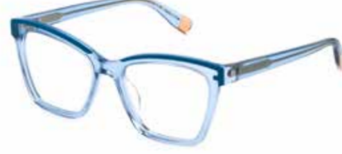
FURLA Ecken, Kanten sowie raffinierte Details an der Front führen einen unverwechselbaren Look vor Augen.