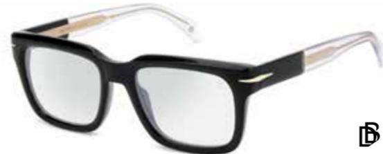
DAVID BECKHAM Die stilisierte Raute an den oberen Kanten und die Drahtkernkonstruktion an den Bügeln bezeugen David B.