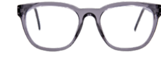
MUR Alles im Flow – der fließende Übergang in die ovale Form harmonisiert mit rundlichen wie eckigen Gesichtern.

KOSTENLOSER SEHTEST Wir bieten Ihnen einen kostenlosen Sehtest mit fachkundiger Beratung, damit Sie immer mit den richtigen Gläsern unterwegs sind. Unabhängig vom Sehtest sollte eine regelmäßige Überprüfung des allgemeinen Gesundheitszustandes der Augen bei einem Augenarzt erfolgen.