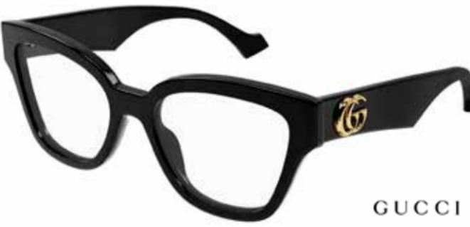
GUCCI Mit voller Wucht! Ein breites Bügeldesign demonstriert Selbstbewusstsein und verleiht pures Luxusgefühl.

Der Luxus legt eine andere Gangart ein. Selbstbestimmt, entschlossen und unbeeindruckt davon, was andere tragen. Markante Muster, Formen und Farben präsentieren sich auf dem gesamten Globus. Dabei formieren sich Frankreich und Italien als bedeutendste Knotenpunkte der Extravaganz.