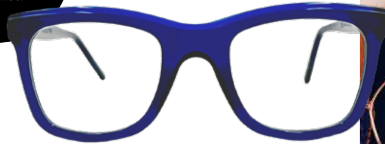
SPITTELBERG Füllige Ränder verkörpern reges Treiben, künstlerische Schöpferkraft sowie gemütliche Behaglichkeit.

Scharfsinn-Fassungen sind auch für Gleitsichtgläser geeignet!