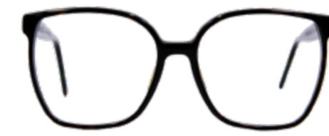
WÖRTHERSEE Volltreffer! Bühne frei für die 70er Jahre. Die weiten, quadratischen Rahmen passen perfekt zu jedem Retro-Look.

Die Marke ist made in Austria, trotzdem im heimischen Markenvergleich preiswert. Jeder Kauf einer Scharfsinn-Fassung stärkt eigenständige, unabhängige Optikerbetriebe und belebt auch die heimische Wirtschaft.