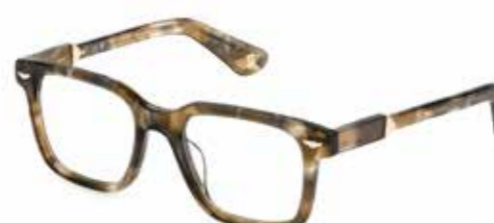
POLICE Buongiorno! Exklusives, marmoriertes Acetat trifft auf markante Proportionen in italienischem Flair.