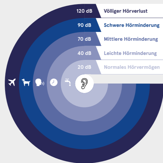
Hörminderung, gemessen in Dezibel: Je leiser die Geräusche, desto weniger nehmen die Betroffenen wahr.

Partielle Hörminderung tritt im Hochtonbereich auf; dabei sind im Gegensatz zur Schallempfindungsschwerhörigkeit lediglich die Haarsinneszellen an der Basis der Cochlea beschädigt, nicht aber jene im innersten Bereich, die für das Hören tiefer Töne zuständig sind.